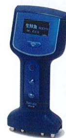
Fish Analyzer™ Type S